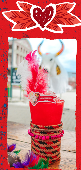
FESTEJO VERMELHO ALCOÓLICO: VODKA KETEL ONE COM TORANJA E ROSAS, PURÊ DE MORANGO, SUMO DE LIMÃO, XAROPE DE AÇÚCAR E ESPUMANTE. R$38,90 NÃO ALCOÓLICO: PURÊ DE MORANGO, SUMO DE LIMÃO, XAROPE DE AÇÚCAR, E SODA. R$28,90

GARANTIDO QUANDO VIBRA É PURO SENTIMENTO, MISTO DE RAÇA E LAMENTO POVO GUERREIRO DA FLECHA E DO AMOR