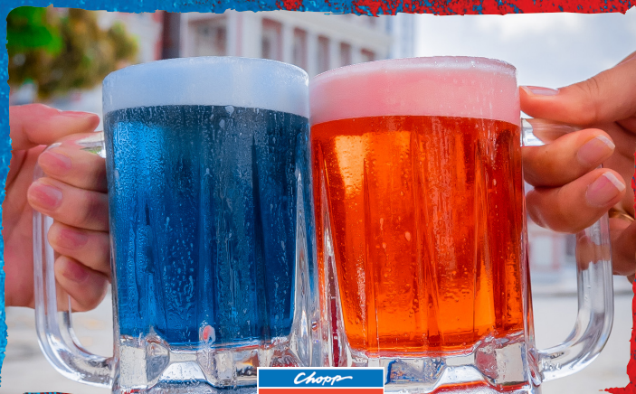
CHOPP AZULOU 300ML R$13,90 / 300ML SUJO R$15,90 500ML R$21,90 / 500ML SUJO R$23,90