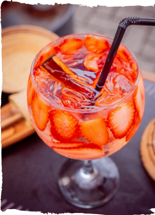
L'AMOUR ROSE GIN BEEFEATER PINK, MORANGO, TÔNICA E CANELA MAÇARICADA. R$55,90