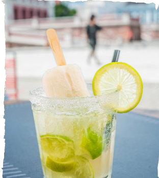
CAIPILE LIMÃO e GRAVIOLA CAIPIRINHA COM PICOLÉ DE GRAVIOLA. — TRADICIONAL R$25,90 — ESPECIAL R$31,90