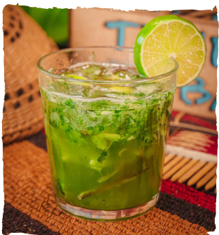
CAIPIRU CACHAÇA DE JAMBU, MACERADA FOLHAS DE COM JAMBU, LIMÃO E XAROPE DE AÇÚCAR (O JAMBU É UMA FOLHA QUE ADORMECE A LÍNGUA. TAMBÉM É USADA NO TACACÁ). $26,90