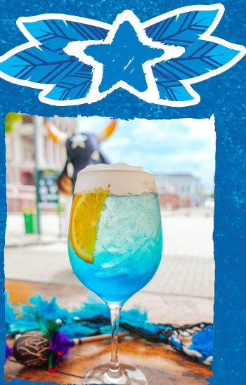
TRIUNFO DO POVO ALCOÓLICO: GIN, XAROPE DE LARANJA, XAROPE DE GENGIBRE, ESPUMANTE, ÁGUA COM GÁS, LARANJA BAHIA, ANIS ESTRELADO, ESPUMA DE LIMÃO-SICILIANO E PAPEL DE ARROZ TEMÁTICO. — GIN TANQUERAY R$61,90 — GIN EURYDICE R$54,90 NÃO ALCOÓLICO: XAROPE DE LARANJA, XAROPE DE GENGIBRE, SODA, LARANJA BAHIA, ANIS ESTRELADO, ESPUMA DE LIMÃO-SICILIANO E PAPEL DE ARROZ TEMÁTICO. R$28,90