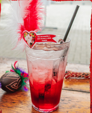
SODA GARANTIDO XAROPE DE MORANGO, ÁGUA GASEIFICADA. R$19,90