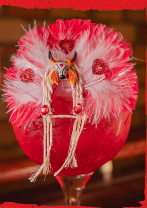
ISA A BELA GUERREIRA ALCOÓLICO: GIN, CURAÇAU RED, LIMÃO ESPREMIADO, ENERGÉTICO DE MELANCIA, PIMENTA ROSA, LIMÃO SICILIANO DESIDRATADO, ESPUMA CÍTRICA E COCAR DO GARANTIDO. — COM GIN TANQUERAY R$61,90 — COM GIN EURYDICE R$52,90 NÃO ALCOÓLICO: XAROPE DE MORANGO, LIMÃO, ENERGÉTICO DE MELANCIA E ESPUMA DE LIMÃO SICILIANO E COCAR DO GARANTIDO. R$40,90