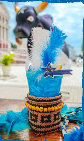
EVOLUÇÃO ESTRELADA ALCOÓLICO: TEQUILA, CURAÇAU BLUE, SUMO DE LIMÃO E SAL NA BORDA DO COPO. R$36,90 NÃO ALCOÓLICO: XAROPE DE LARANJA, SUMO DE LIMÃO, SODA E SAL NA SORDA DO COPO. R$28,90

CAPRICHOSO É A LUZ, É O SOM QUE TOMA CONTA DA MINHA TERRA RUFAR FORTE O TAMBOR, BRILHA FORTE O AMOR QUE CHEGOU MARUJADA DE GUE