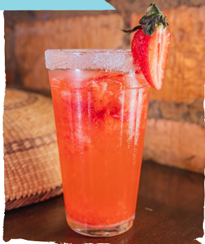
CAIPIFRUTA FRUTA ( ABACAXI, MORANGO OU MARACUJÁ), VODKA, LIMÃO E XAROPE DE AÇÚCAR. — NACIONAL R$36,90 — IMPORTADA R$56,90