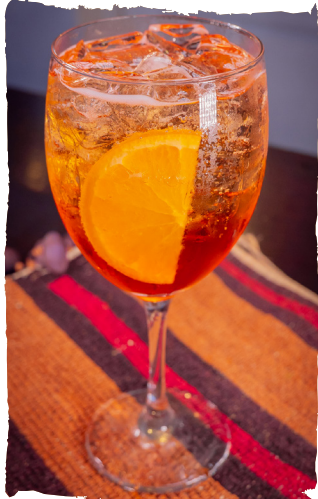
APEROL SPRITZ APEROL, ESPUMANTE, ÁGUA COM GÁS E LARANJA BAHIA. $38,90