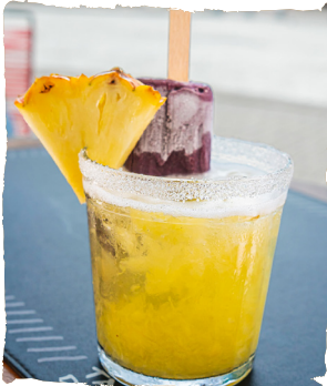
CAIPILE ABACAXI e AÇAÍ CACHAÇA, ABACAXI, XAROPE DE AÇÚCAR E PICOLÉ DE AÇAÍ. — TRADICIONAL R$25,90 — ESPECIAL R$33,90