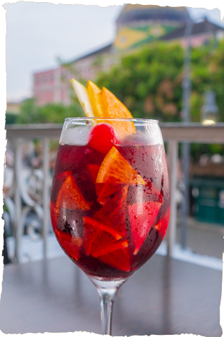
SANGRIA VINHO AROMATIZADO COM CANELA, LARANJA BAHIA, LIMÃO SICILIANO, NOZ MOSCADA, ANIS ESTRELADO, AÇÚCAR MASCADO E MAÇA VERDE. R$38,90