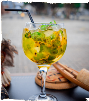
LA PASSION GIN TANQUERAY, MARACUJÁ, ÁGUA TÔNICA, HORTELÃ E XAROPE DE AÇÚCAR. R$46,90