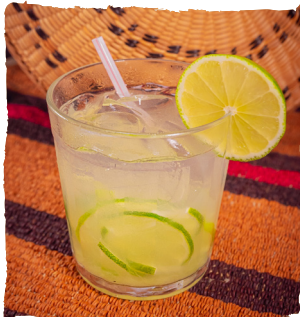
CAIPIRINHA CACHAÇA, LIMÃO E XAROPE DE AÇÚCAR. — TRADICIONAL R$17,90 — ESPECIAL R$20,90