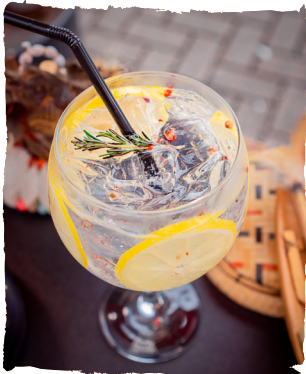
LE MAGNIFIQUE! GIN TANQUERAY, TÔNICA, LIMÃO SICILIANO, PIMENTA ROSA E ALECRIM. R$46,90