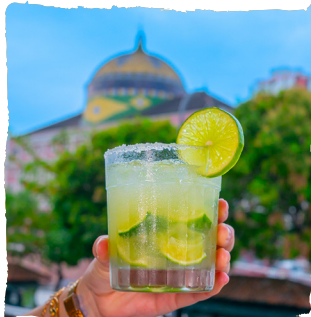
CAIPIROSKA VODKA, LIMÃO E XAROPE DE AÇÚCAR. —NACIONAL R$19,90 —IMPORTADA R$30,90